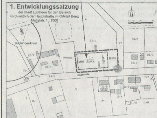
Übersicht zur Satzung Benz

Lübbthen, den 21.10.2015 Siegel Lindenau (Bürgermeisterin)