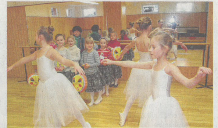
Kleine Tänzerinnen beim Training im Tanzsaal.

OHNE Werbung sind Sie vielleicht erfolgreich