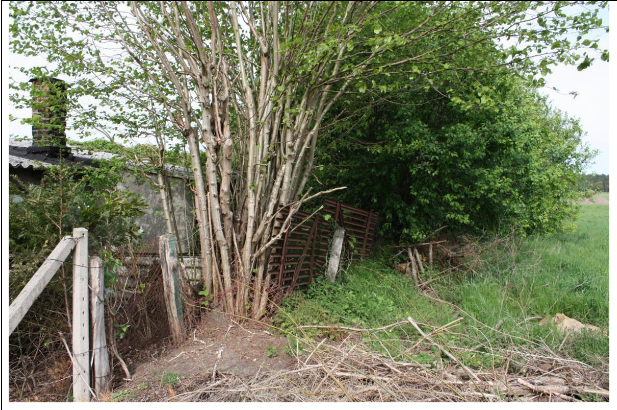
LWL11528, Biotopname: Hecke; überschirmt, Gesetzesbegriff: Naturnahe Feldhecken

Für die Feldhecke ist eine weitere, aber nicht erhebliche, Beeinträchtigung im kausalen Zusammenhang mit dem Projekt und seinen Auswirkungen einzustellen. Durch die Lage innerhalb des im rechtswirksamen F-Plan gekennzeichneten Mischgebietes, zwischen vorhandener Bebauung und der bisherigen Teilnutzung (Sportplatz / Garten-Kleintierhaltung - vorhandenes Störpotential) ist für das unmittelbar angrenzende Wertbiotop LWL11528 eine deutliche Vorprägung einzustellen.