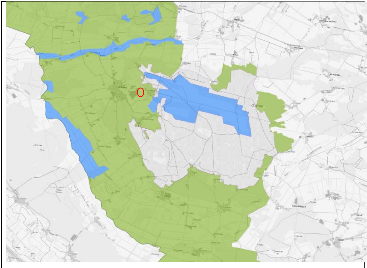
Karte 2: Schutzgebiete - Zonen Biosphärenreservat