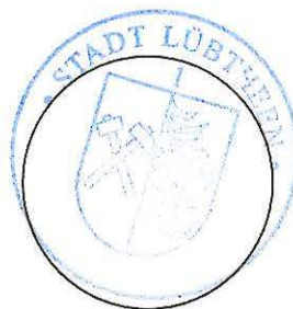
Stadt Lübben Die Bürgermeisterin