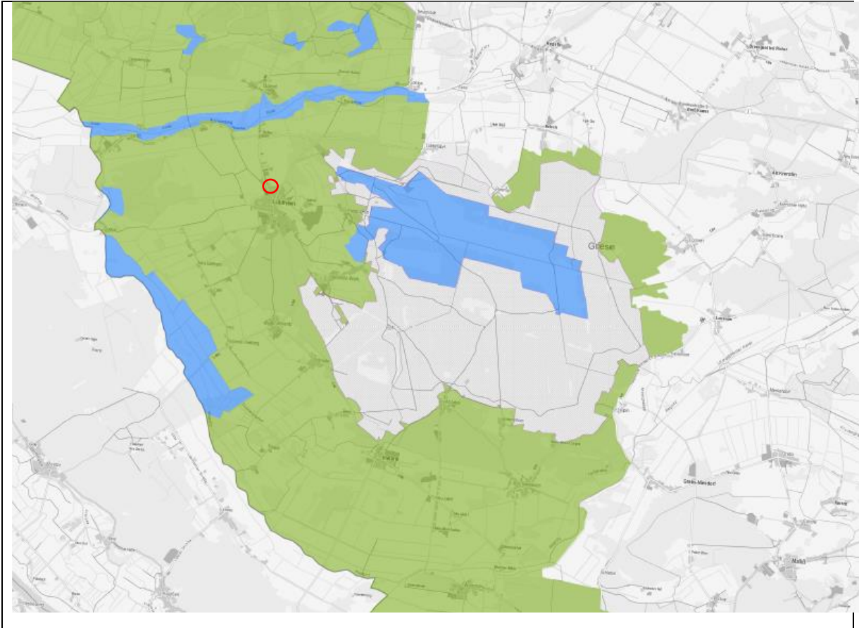
Karte 2: Schutzgebiete - Zonen Biosphärenreservat